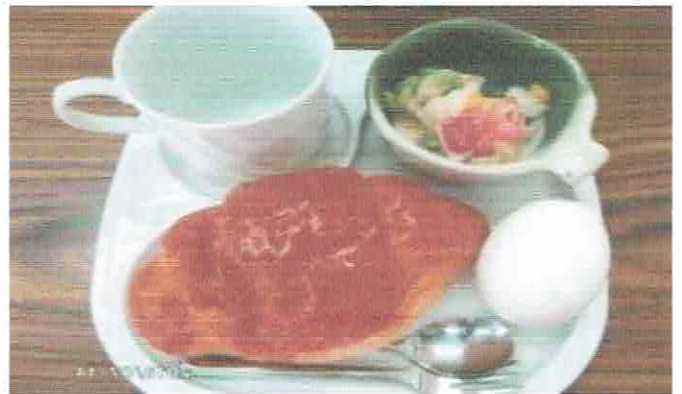
ふれあい喫茶 (第2・4日曜日 10:00～12:00) 地域住民全ての方にご利用頂けます(100円)