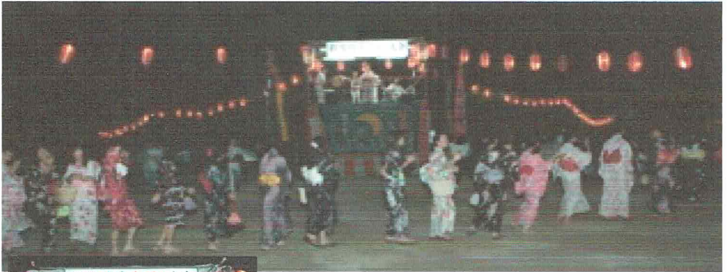
納涼盆踊り大会 (7月27・28日 於：横堤小学校)

横堤地域の皆様のお力添えを頂き 納涼盆踊り大会が無事終了致しました (来場者 5,048名の参加者がありました)