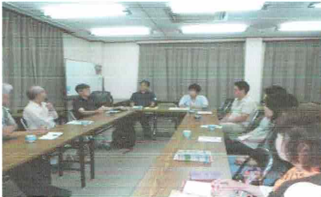
井戸端会議 (第3月曜日 19:00～) 地域住民全ての方が自由に参加できます