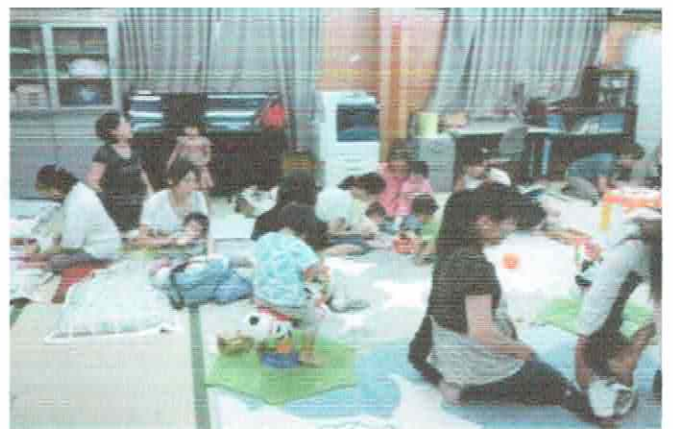
子育てサロン (第2火曜日 10:00～12:00) 就学前児童と保護者の方 保健士さんも来られます！